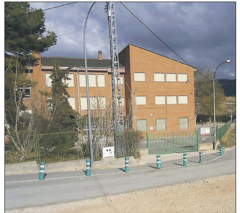
Colegio público Pla i Beltrán

Por contra, la guerra de Ucrania aportó mucho alumnado extra a algunas poblaciones de la provincia, especialmente en Torrevieja.